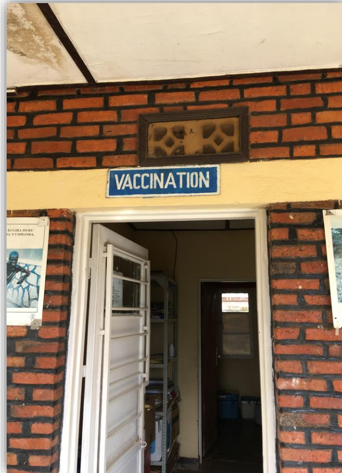
Gesundheitszentren und ...