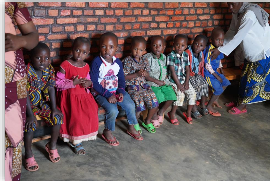
Eindrücke aus den Early-Child-Development-Zentren